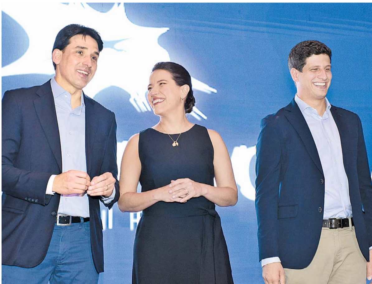
AUTORIDADES: o ministro pernambucano Silvio Costa Filho, a governadora Raquel Lyra e o prefeito do Recife, João Campos, foram três das autoridades que prestigiaram a inauguração do Novotel Recife Marina