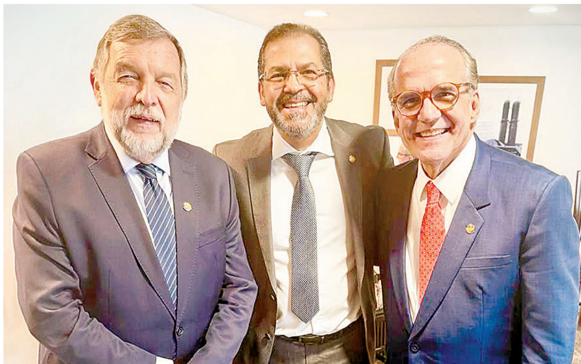
ENCONTRO: um clique exclusivo para nossa Coluna Persona do recente encontro do senador pernambucano Fernando Dueire (MDB) com o senador Flavio Arns (PSB-PR) e o vereador do Recife Carlos Muniz (PSB)